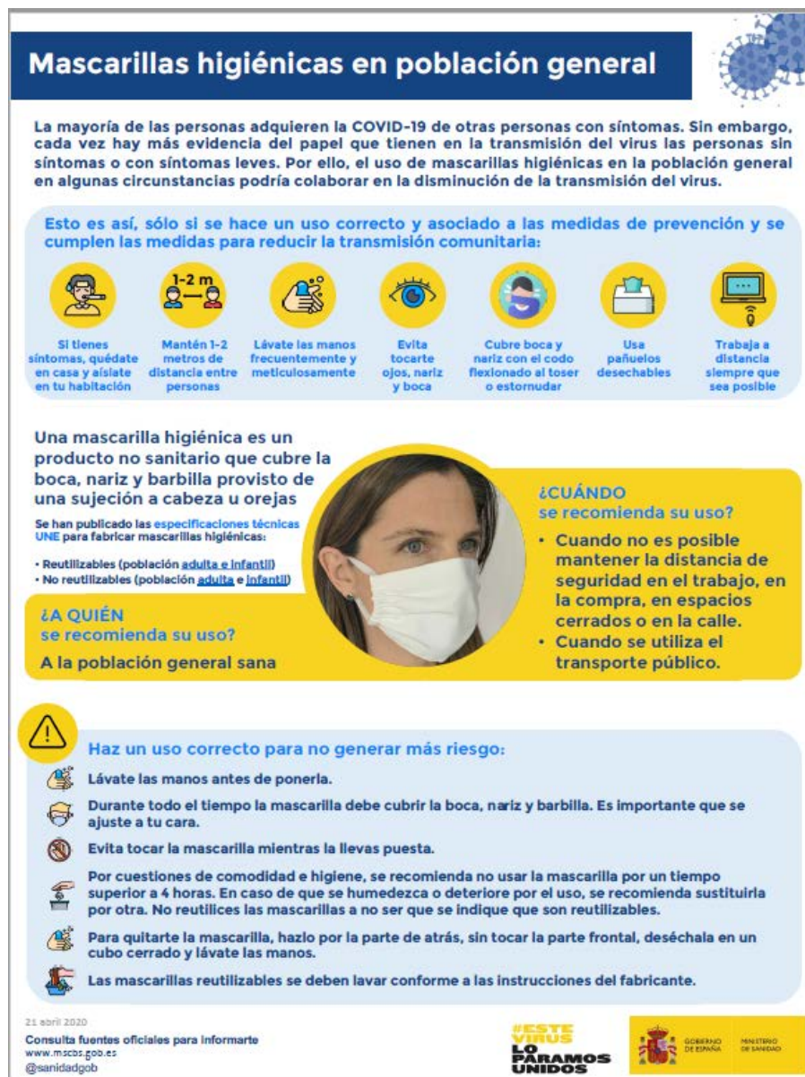
Mascarillas higiénicas en población general (Ministerio de Sanidad, 2020)

Nota: las mascarillas quirúrgicas y las mascarillas higiénicas no son consideradas EPI.